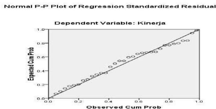
Gambar 2 : Uji Linearitas

Dalam penelitian ini, untuk uji linearitas digunakan Grafik tersebut yang diperlihatkan dibawah ini, terlihat bahwa titik-titik bergerak menuju model regresi dengan garis linear, sehingga dapat disimpulkan bahwa model regresi penelitian ini adalah linear.